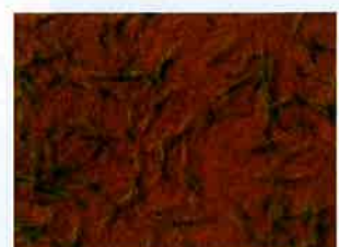
ホタルイ3葉期まで