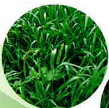
アキノエノコログサ